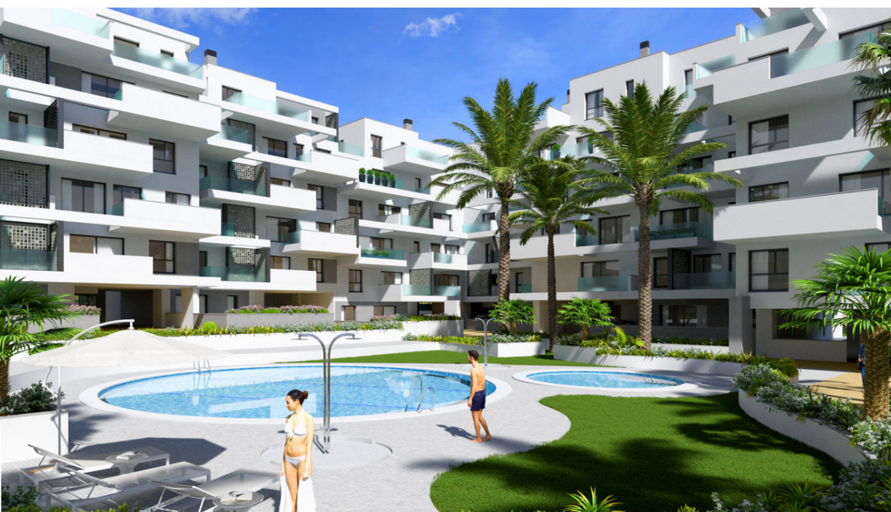
Urbanización, Alexa, Costa del Sol

El documento puede contener información relativa a los pagos, la financiación e incluso las zonas comunes.